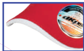
CANTO DE VISERA EN CONTRASTE