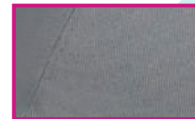
GABARDINA 100% ALGODÓN