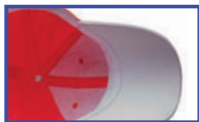
VISERA EN CONTRASTE