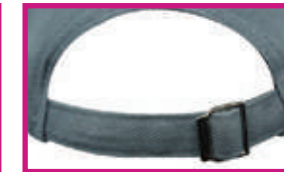
AJUSTE DE HEBILLA