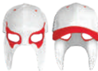
BLANCO ROJO 551