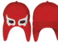
ROJO BLANCO 555