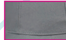
PUNTADA FRONTAL DE SEGURIDAD