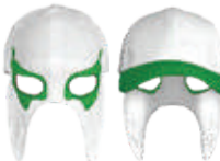
BLANCO BANDERA 550