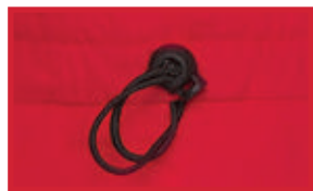
AJUSTE DE CORDÓN ELÁSTICO