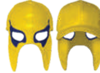
AMARILLO MARINO 557