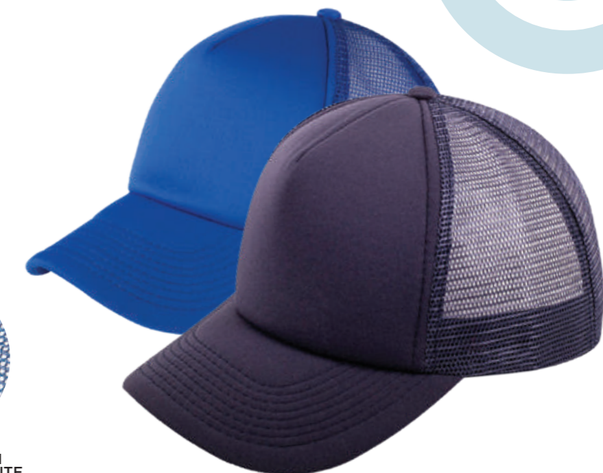
MALLA DE NYLON AL COLOR DEL FRENTE