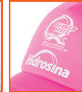
RECORTE DE VINIL