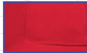
PUNTADA FRONTAL DE SEGURIDAD