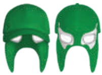
BLANCO VERDE 556