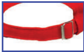
AJUSTE DE HEBILLA