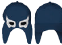
MARINO BLANCO 552