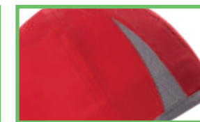
RESPIRADORES TRIANGULARES DE JERSEY