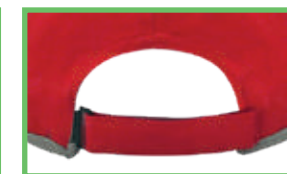
AJUSTE DE VELCRO