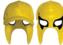
AMARILLO NEGRO 558