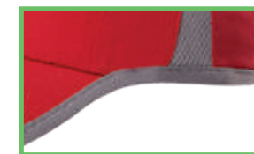
CONTORNO LINEAL EN CONTRASTE