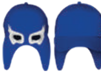
ROYAL BLANCO 553