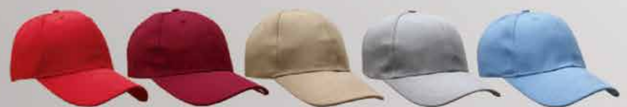
rojo vino khaki gris cielo