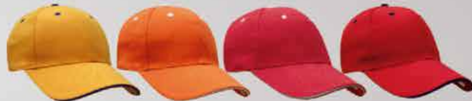
amarillo /rey naranja /bco. rojo /bco. rojo /mar.