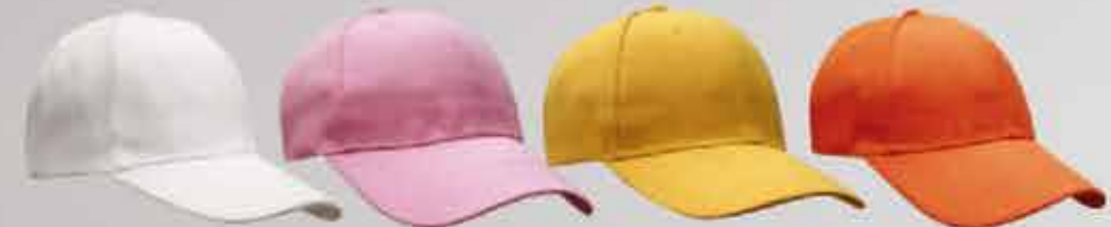
blanco rosa rosa naranja