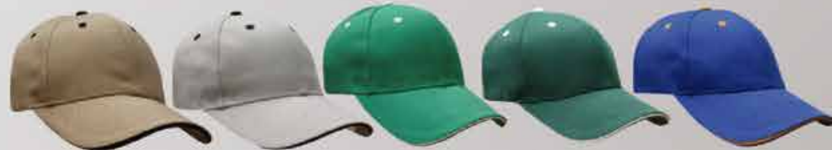
khaki /ngo. gris /ngo. verde /bco. forrest /bco. rey /ama.