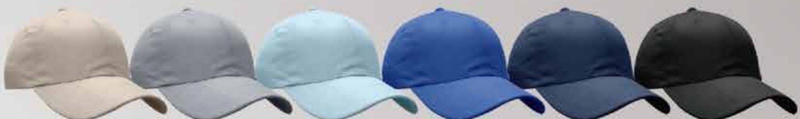
khaki gris cielo rey marino negro