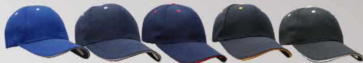
rey /bco. marino /bco. marino /roj. negro /ama. negro /bco.