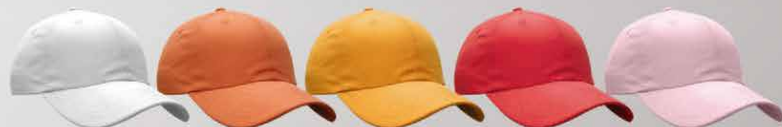
blanco amarillo naranja rojo rosa

Ojillo metálico sin refuerzo Sin sandwich