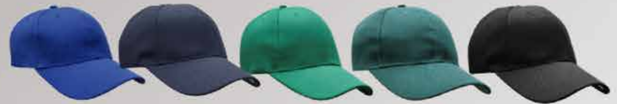
rey marino verde forrest negro