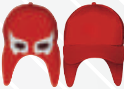
ROJO OJOS BLANCOS/555