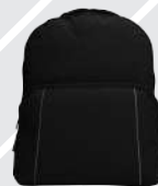
NEGRO JASPE /119