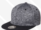
❖ NEGRO JASPE/119