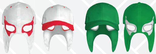
BLANCO OJOS ROJOS/551