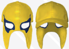
AMARILLO OJOS MARINO/557