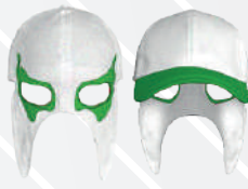
BLANCO OJOS BANDERA/550