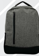
JASPE CLARO / 127