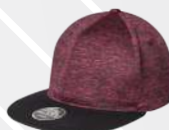
❖ ROJO JASPE/205