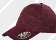
❖ ROJO JASPE/205