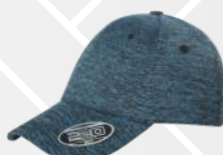
❖ ZAFIRO JASPE/201