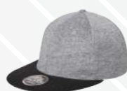
❖ JASPE CLARO/127