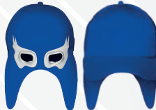
ROYAL OJOS BLANCOS/553