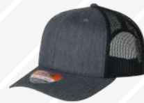
JASPE OSCURO NEGRO/116