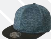
❖ ZAFIRO JASPE/201