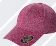
❖ ROSA JASPE/206