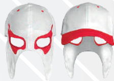
BLANCO OJOS ROJOS/551