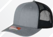
JASPE CLARO NEGRO/127