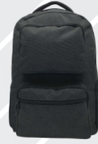
NEGRO JASPE / 119