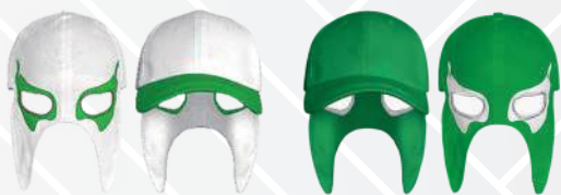
BLANCO OJOS BANDERA/550