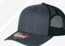
JASPE OSCURO NEGRO/116