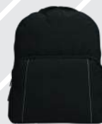
NEGRO JASPE /119