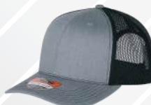
JASPE CLARO NEGRO/127