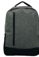
JASPE CLARO /127