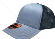
JASPE CLARO NEGRO/127